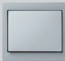
Berker K.1, alu