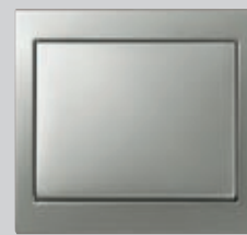
Berker K.5, Edelstahl

So klar und kompromisslos die äußere Form, so widerstandsfähig das Innenleben: In wassergeschützter IP 44-Ausstattung ist die Berker „K“-Serie die logische Wahl für alle Feucht- und Außenräume.