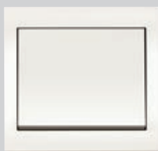
Berker K.1, polarweiß