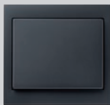
Berker K.1, anthrazit