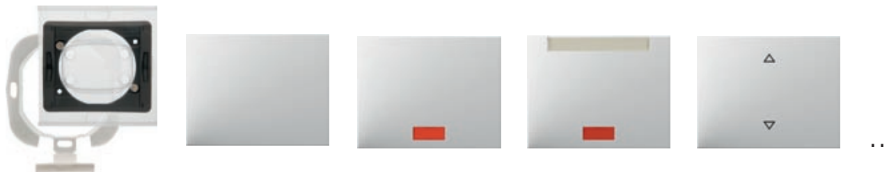
Dichtungsset K.1/K.5 für Wippschalter/-taster