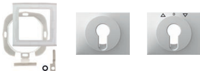
Dichtungsset K.1/K.5 für Schlüsselschalter/-taster