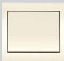
Berker K.1, weiß

Die Schutzart IP 44 wird dann erreicht, wenn die montierten Artikel IP 44 geeignet sind (✓ Kennzeichnung im Berker Katalog-Kapitel „Berker K.1/K.5“ beachten) und der Zusammenbau entsprechend der Montageanleitung erfolgt!